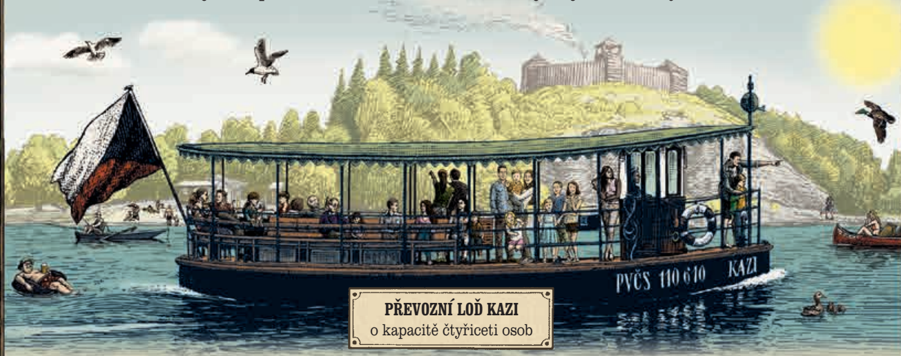
PŘEVOZNÍ LOŽ KAZI o kapacitě čtyřiceti osob

je obnoven v místě, kde podle pověsti stávalo staroslovanské hradiště Kazín. Ve stejných místech byl zmiňován nejstarší přívoz v Čechách, který navazoval na místní stezky. Plujte na přívozu slavného siláka Bivoje a jeho kněžny Kazi.